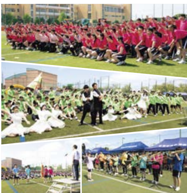
令和6年6月5日開催。「夢」のスローガンのもと開かれた体育祭。12の連合チームが優勝をめざし奮闘しました。