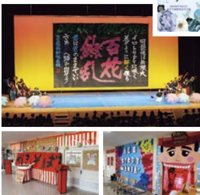
令和6年9月1日開催。中学生と保護者を対象としたオープンスクールを併催し、文化祭を通じて学校生活の様子を多くの方へ発信する機会となりました。